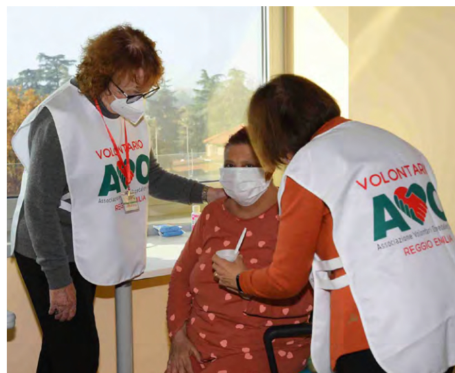
volontarie AVO in servizio in Medicina Oncologica