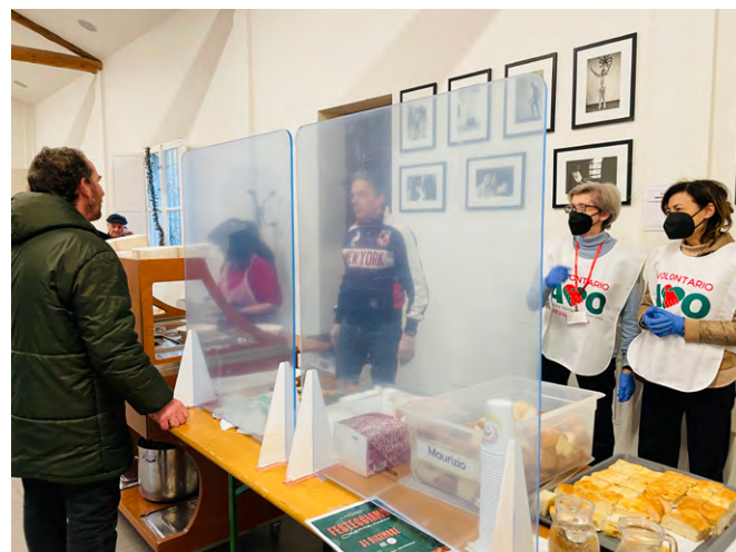
volontarie in servizio alla Mensa Caritas di San Maurizio