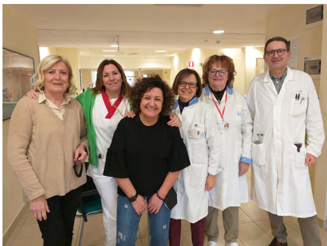
volontarie in servizio nel reparto di Medicina Oncologica

L'AZIONE DELL'IMBOCCAMENTO È OGGI SOSPESA E NON PIÙ PRATICATA DAL VOLONTARIO AVO , perchè di esclusiva competenza del personale sanitario e delle strutture, pertanto la presenza del volontario durante il momento dei pasti è unicamente finalizzata a sostenere ed incoraggiare l'ammalato o l'anziano, a tagliare o sminuzzare il cibo, a sollevare il vassoio o il piatto per agevolare l' ASSUNZIONE AUTONOMA DEL CIBO .