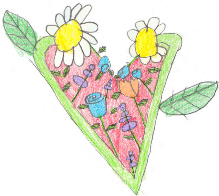
fiore di Lorenzo Scuola Primaria Zibordi a/s 25/26