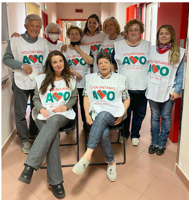
volontari AVO in servizio in Medicina Fisica e Riabilitativa

Il volontario AVO è a supporto dei bisogni relazionali ed offre una presenza amichevole instaurando un dialogo con l'ammalato ed i suoi familiari; collabora con il personale sanitario senza mai sostituirsi a quelle che sono le loro mansioni e durante il momento del pasto è accanto al paziente per sostenerlo ed incoraggiarlo agevolando l'assunzione autonoma del cibo, non è consentito l'imboccamento, poichè è una azione di esclusiva competenza del personale sanitario.