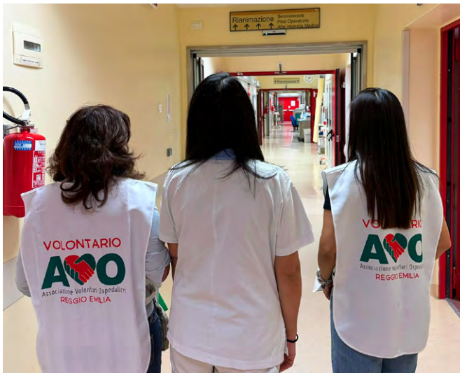
volontarie AVO in servizio nel reparto di Rianimazione

Fin dall'inizio la figura del volontario AVO è diventata un punto di riferimento per i familiari , che si aprono anche a qualche confidenza durante l'attesa per il colloquio col medico.