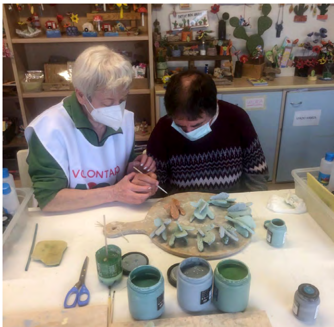
volontaria AVO al Centro Socio Riabilitativo La Cava

Il servizio del volontario AVO è caratterizzato dalla relazione con l'ospite, fatta di dialogo , di ascolto , di affiancamento nei lavori manuali (atelier, giardinaggio, cura dell'ambiente...).