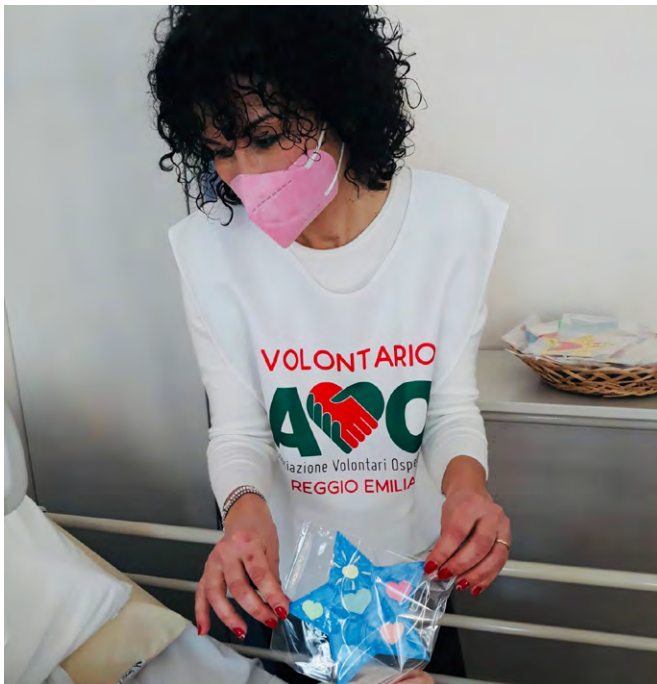
volontaria AVO in servizio nel reparto di Neurologia

Il volontario AVO si accosta a ciascun ammalato per instaurare un dialogo che possa alleviare la sofferenza o la solitudine ; accoglie i familiari fornendo informazioni sull'organizzazione e sulle modalità di accesso al reparto e successivamente li accompagna al letto del proprio congiunto ; durante il momento del pasto è accanto all'ammalato per sostenerlo ed incoraggiarlo agevolando l'assunzione autonoma del cibo, non è consentito l'imboccamento, poichè è una azione di esclusiva competenza del personale sanitario.