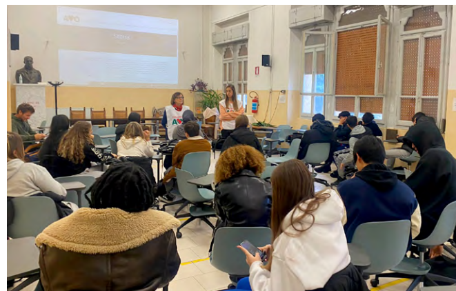
incontri dei volontari nelle Scuole dell'Infanzia e Primarie